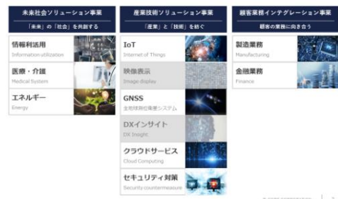
中四国カンパニーのサービス領域

本システムは、水質分析業務の受付から採水、分析、計量証明書出力、納品・請求の一連の業務を一元管理するシステムです。Web基盤でシステムを構築しております。